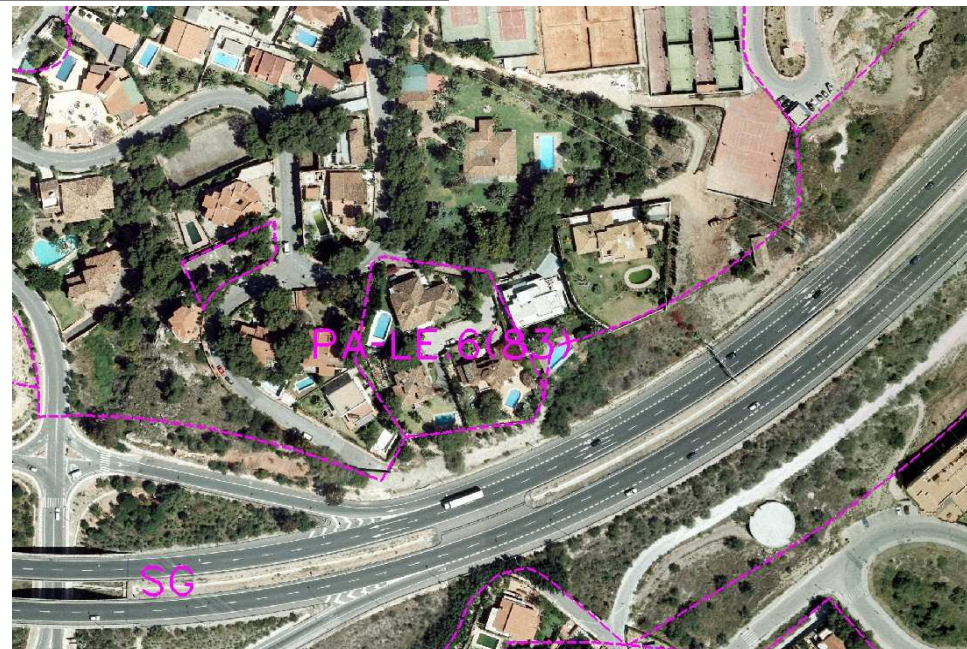
Ordenación Pormenorizada Completa

Plan Especial de Infraestructuras Básicas: